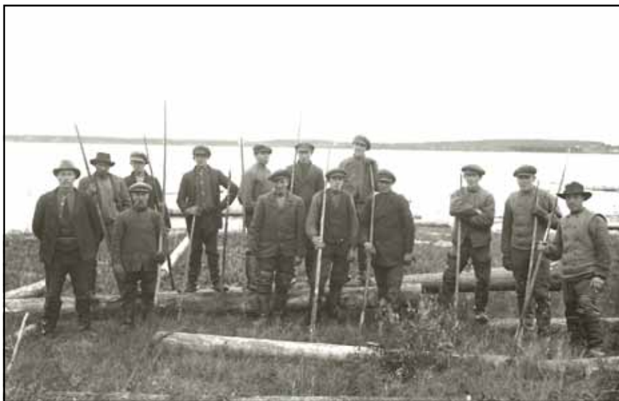
Tretton strandrensare med förman iklädda smorda läderstövlar

I slutet av sommaren kom strandrensarna. Av de miljontals stockar som under sommaren flottats efter Luleälven hade en del vid hårda vindar och vid högvatten hamnat efter stränderna och uppe på land. Dessa skulle nu återbördas till älven för färd ned till sorteringsstället i Södra Sunderbyn. Avans unga pojkar gömde sig i snåren och hörde med rysningar strandrensarnas svordomar över ungdjävlar som hade spikat ihop flottor av det bästa timret. Men rensningen var för karlarna en lättsam avslutning på flottningen och människans ankomst till byarna firades längre tillbaka med stora fester.